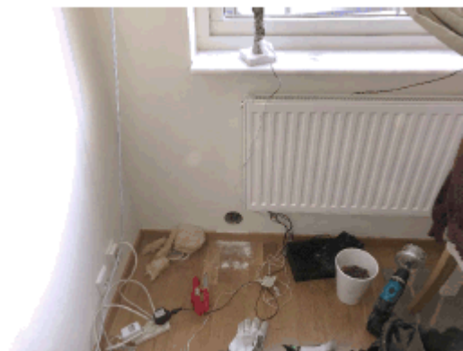
Foto 25- Inspektionshål i yttervägg mot nordost

Har bifogat ett par exempel på hur hålen kan se ut och typiska ställen där vi brukar ta upp dem. De första fotot visar ett öppnat hål, i den andra bilden har vi satt igen hålet med doslock.